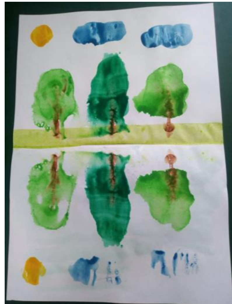
Рисунок отпечатался на другую поверхность. Получилось, что одни деревья стоят на берегу и смотрят в небо, а другие отражаются в воде.